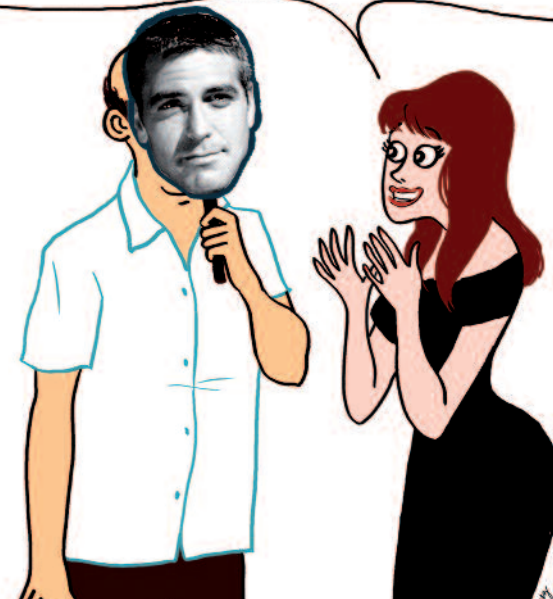
► Tous les dessins de Lucile Gomez sur enaffinite.fr.

Et au dessert, n'oublie pas surtout de dire à ma mère que sa cuisine est divine.