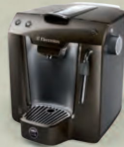
Favola Plus ELM5200CB

Sa palette de 6 coloris acidulés ou métallisés, inscrit Favola™ dans toutes les tendances de l'univers de la cuisine et laisse l'embaras du choix.