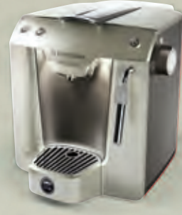
Favola Plus ELM5200CB