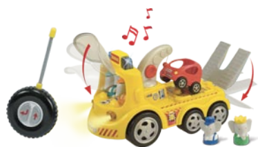
Dépanneuse Radiocommandée de Babar

Le Train Express de Babar (dès 18 mois, environ 30 €) emporte Babar et ses amis au bout du monde. Sa locomotive et ses deux wagons ne seront pas de trop pour accueillir la famille au grand complet avec ses 9 figurines (conducteur, Babar, Céleste, Alexandre, Arthur...). C'est sur une mélodie entraînante et en lumière que le convoi voyage joyeusement. Le conducteur parle en français et en anglais !