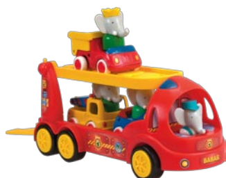
Mon Camion de Transport Babar