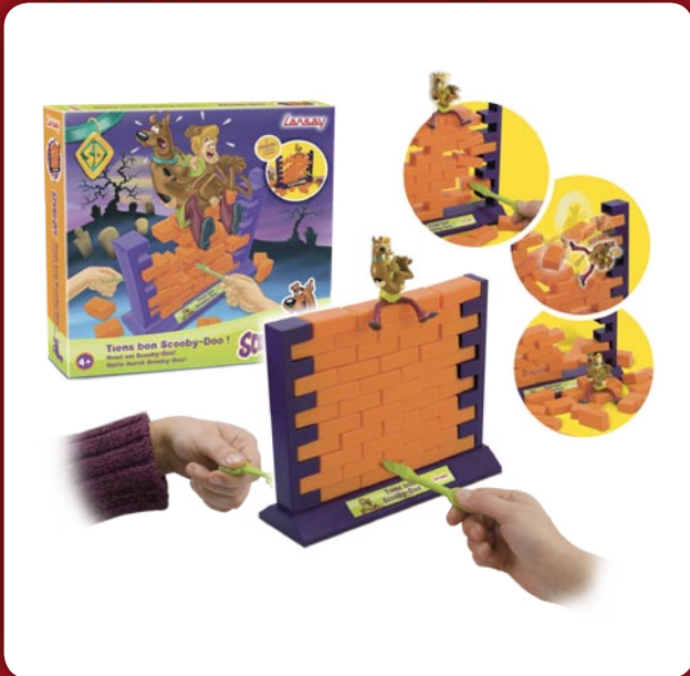
Tiens Bon Scooby-Doo

Chasse O Bulles (dès 3 ans, environ 25 €), Prem's (dès 8 ans, environ 20 €), Astérix le Défi de l'arène (dès 4 ans, environ 31 €), Titeuf le Jeu (dès 8 ans, environ 27 €), Scooby-Doo Panique au Château (dès 4 ans, environ 28 €)