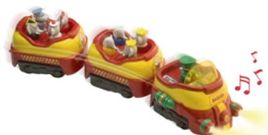
Train Express de Babar

Babar Petits Câblins (premier âge, environ 15 €), Babar ou Céleste avec Bébé (premier âge, environ 16 €), Peluche Babar Articulée (premier âge, environ 21 €)