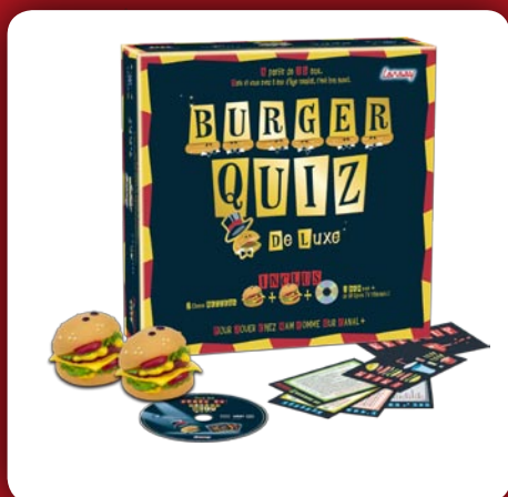
Burger Quiz De Luxe

Nostalgiques, gais lurons et admirateurs d'Alain Chabat s'adonneront avec plaisir à quelques parties de Burger Quiz De Luxe (dès 15 ans, environ 25 €). Fidèle réplique du jeu TV culte de Canal+ (actuellement rediffusé sur Comédie), Burger Quiz De Luxe réunit les équipes Mayo et Ketchup pour un face-à-face épique, mais surtout très comique. Épreuves et quiz, à l'humour aussi décalé que l'émission, se succèdent. Objectif : collecter un maximum de Miam et affronter sans frémir le fameux Burger de la Mort. Version De Luxe oblige : le jeu est livré avec des accessoires premium, deux buzzers et un DVD bonus.