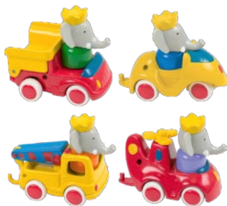
Mini véhicules Babar Assortis

Toujours au top, Babar continue d'offrir sa protection et son affection à ses admirateurs. Héros transgénérationnel aux fortes valeurs éducatives, Babar est une star du petit écran qui mobilise toujours autant les jeunes téléspectateurs. Et son actualité continue de battre son plein, fêtant son 75e anniversaire en 2006 et partenaire du Service Maternité Famille pour la distribution gratuite de 750 000 trousseaux cadeaux à son effigie en 2007, Babar n'en finit pas de nous surprendre.