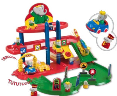
Mon Garage Électronique Babar

Pour se donner les moyens d'aller plus loin, le Pack de 3 Mini-Véhicules Babar (dès 18 mois, environ 14 €) réunit l'hélicoptère, la moto mais aussi un modèle exclusif : la camionnette du marchand de glaces.