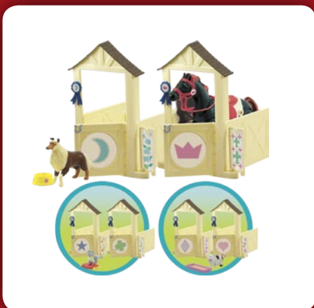
Box et les Accessoires Assortis

De quoi tout organiser, des préparatifs jusqu'à la cérémonie de remise des médailles ! Enfin, l'Écurie Électronique (dès 4 ans, environ 40 €) offre aux fans de la série un décor de rêve. Elle réunit tous les éléments indispensables à l'entretien des chevaux (balai, botte de foin, panier de carottes, couverture, râteau...). On peut activer des effets sonores et lumineux : la douche émet un son de jet d'eau et la lumière fonctionne. Cette écurie permet de vivre des aventures plus vraies que nature !