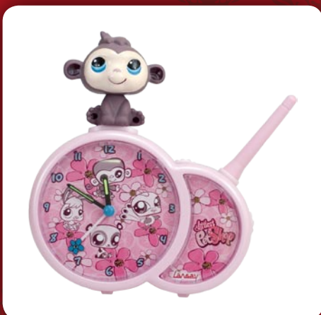
Radio-Réveil Pet Shop