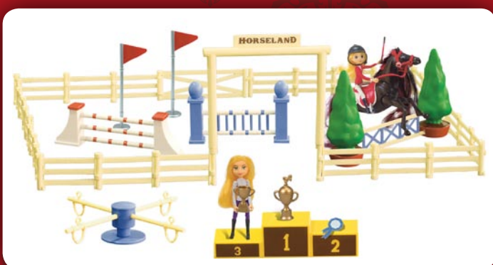
Coffret de Compétition