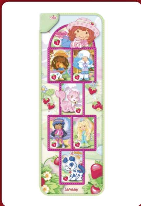
Marelle Électronique de Charlotte