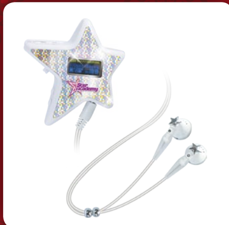
Lecteur MP3 Star Academy

Star Machine Karaké CDG Star Academy (dès 6 ans, environ 50 €), Star Machine DVD/CDG Star Academy (dès 6 ans, environ 60 €)