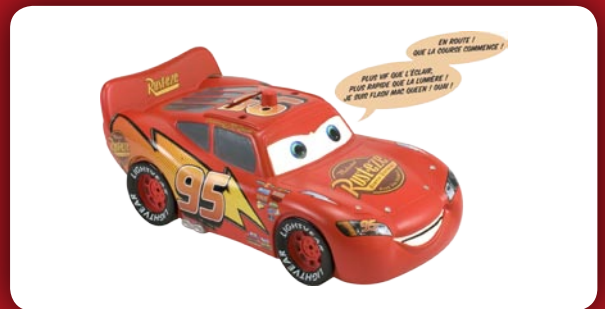
Tirelire Parlante Cars

Les fans du film Cars, œuvre de référence des célèbres studios d'animation Disney/Pixar, vont être comblés car c'est un Flash McQueen flambant neuf qui leur servira de coffre-fort. Équipée d'un bouchon attaché pour ne jamais le perdre, la Tirelire Parlante Cars (dès 4 ans, environ 24 €) égaye le décor tout en prenant sa mission très à cœur. Sa carrosserie rutilante fendue d'un grand sourire invite à la bonne humeur et rappelle aux enfants qu'il n'y a pas que la compétition dans la vie.