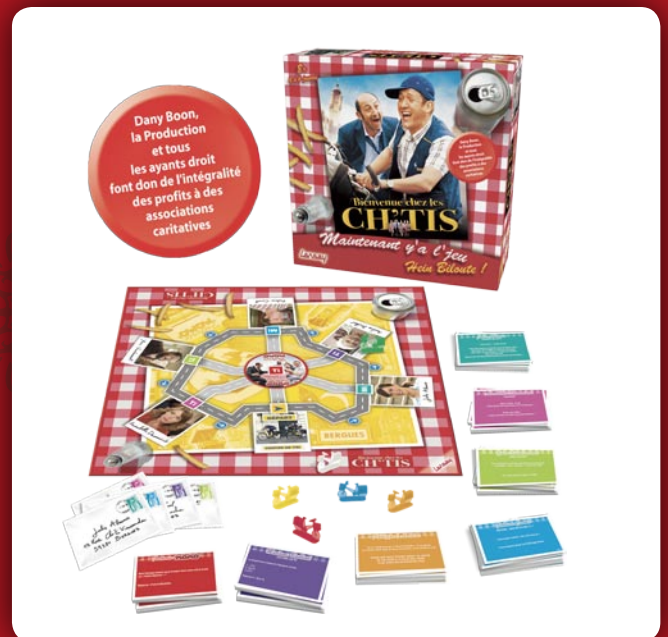
Bienvenue chez les Ch'tis

Film francophone ayant réalisé le plus d'entrées en salles de l'histoire du cinéma français, le déjà mythique Bienvenue chez les Ch'tis a désormais son jeu officiel (dès 8 ans, environ 25 €). C'est dans le petit monde paisible de la ville de Bergues que les joueurs retrouvent l'univers plein d'humour de Dany Boon et de Kad Merad. Qui finira le premier la tournée du facteur ? La question trottera dans la tête des joueurs tout au long des épreuves, des simples questions sur le Nord jusqu'à l'immersion dans les scènes emblématiques du film. Respectant l'esprit et l'humanité de cette comédie événement, Lansay jouera le jeu jusqu'au bout en reversant 3 euros, pour chaque vente, à des associations caritatives.