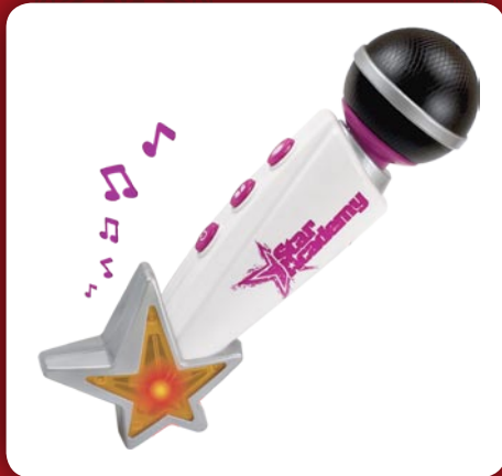
Micro Portable Musical Star Academy