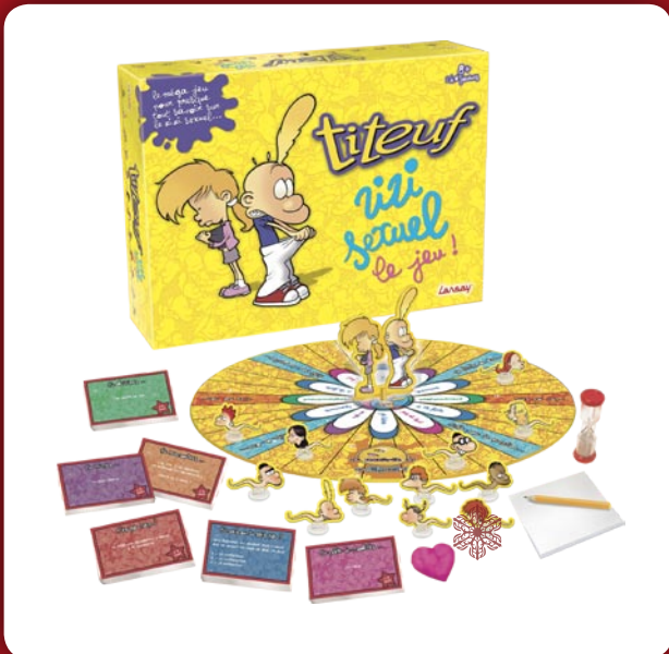
Titeuf Zizi Sexuel le Jeu