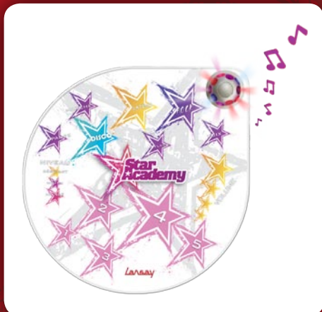
Tapis Musical et Lumineux Star Academy

Alors que les castings de la huitième saison battent leur plein, Lansay continue de faire le bonheur des innombrables adeptes de la Star Academy en leur fournissant des accessoires de scène qui leur permettront de briller comme de véritables stars. La dernière édition de la Star Academy a confirmé son statut d'émission culte avec 6 millions de téléspectateurs en moyenne, soit 54,3 % de part audience sur les filles de 4 à 14 ans. Parallèlement, avec un magazine numéro 2 de la presse ado, la Star Academy a attiré plus de 1,5 million de spectateurs lors de ses tournées et vendu plus de 15 millions de disques.