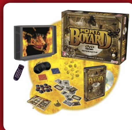
Fort Boyard DVD interactif