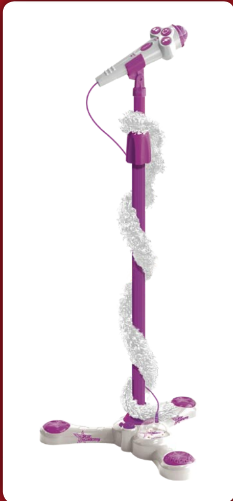
Micro Boa Star Academy