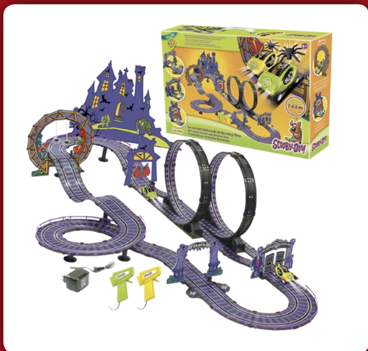
Circuit Infernal de Scooby-Doo

Depuis ses premières diffusions aux États-Unis en 1969, la joyeuse bande du Scooby Gang arpente les lieux hantés pour démystifier les phénomènes paranormaux. Mascotte de cette fine équipe, le dogue Scooby-Doo, plus poltron dans l'âme que héros, contribue malgré lui à élucider chaque affaire. Cette série fait toujours recette et ses diffusions, quotidiennes sur Cartoon Network et Boomerang et programmées le week-end sur France 3, en font le leader de sa tranche horaire. Héros d'un magazine mensuel vendu à 41 000 exemplaires, Scooby-Doo cartonne aussi en DVD avec 900 000 vidéos vendues.