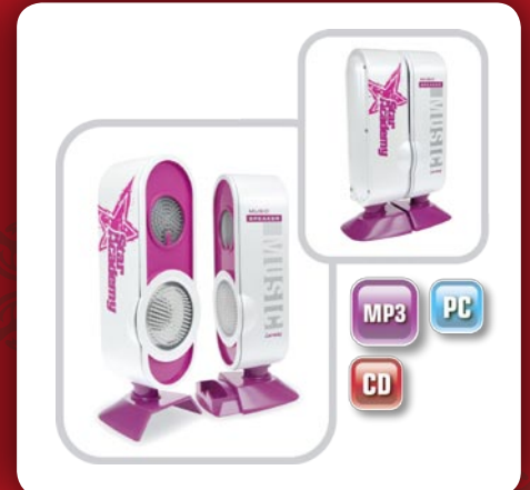
Haut-parleurs Star Academy