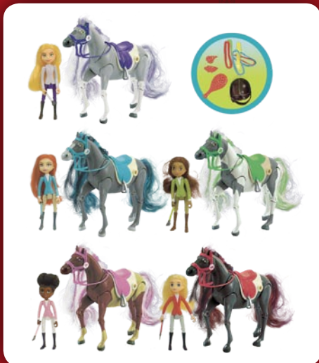
Chevaux avec Personnages Articulés Assortis

Inspirée d'une communauté Internet américaine entièrement dédiée au monde de l'équitation et comptant plus de 2 millions de membres, la série animée Horseland est diffusée quotidiennement sur France 5 depuis le mois de juin 2007 et sur Télétoon depuis le mois d'octobre. Narrant les aventures équestres et sentimentales que vivent jeunes cavaliers et cavalières ainsi que celles de leurs montures, Horseland mobilise aujourd'hui l'attention de plus de 1 million de téléspectateurs âgés de 4 à 10 ans.