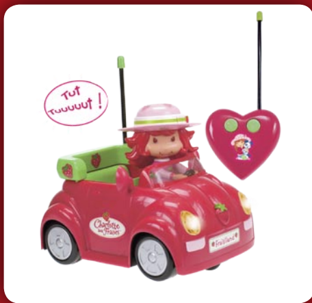
En Voiture Charlotte